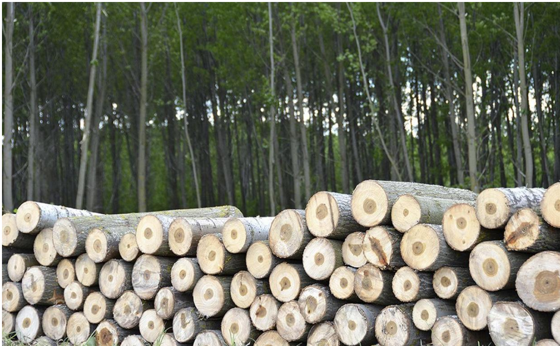
Fig.5.31. Imagen de la tala de chopos.

Como medida de prevención de carácter fitosanitario se debe evitar el traslado de madera y restos vegetales del anterior lugar de trabajo, sobre todo si estaba ubicado en otra CCAA. Para ello la maquinaria (skidder, procesadora, autocargador, etc.) debe venir libre de material vegetal adherido, incrustado o depositado sobre ella, por lo que habrá de haberse realizado la limpieza de la misma (barrido, soplado, etc.) con carácter previo a la entrada en monte.