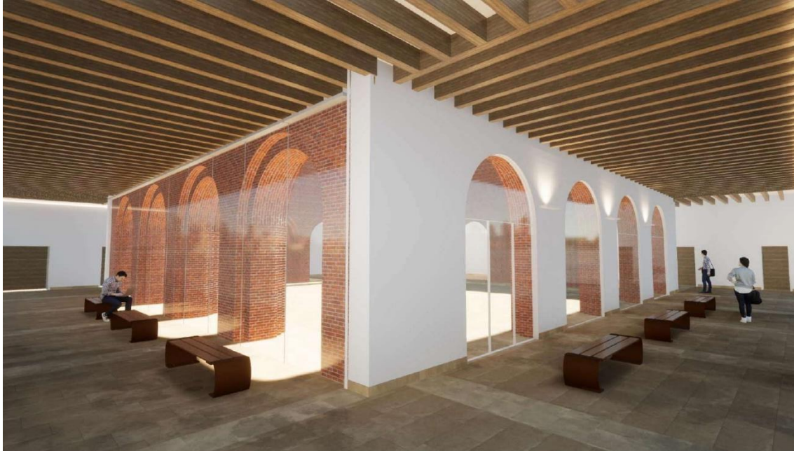
Fig.5.18. Unidad de Ejecución 16 del Plan General Municipal de Alfaro.

las fachadas interiores del claustro, se recuperan los huecos cegados de las arquerías en planta baja del mismo. Finalmente, se levantarán nuevas distribuciones interiores ajustadas al programa de necesidades, se mejorará el aislamiento térmico y acústico mediante la sustitución carpinterías y trasdosados interiores, así como la implantación de nuevas instalaciones.