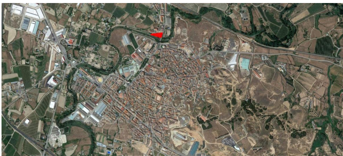
Fig.5.59. Plano de situación de la parcela donde se ubicará el parking de autocaravanas.

Este camino se encuentra reconocido por el planeamiento como parte del sistema de equipamientos (espacios libres), y en consecuencia pertenece al conjunto de zonas verdes y equipamientos del suelo urbano que componen el polideportivo municipal. El tratamiento de asfalto no ha urbanizado ni dotado de los servicios propios del suelo urbano, simplemente ha mejorado el camino existente con una capa de asfalto que evite la existencia de charcos y oquedades. Para ello, el coste de la ejecución ha supuesto una cantidad de 40.809,43 €.