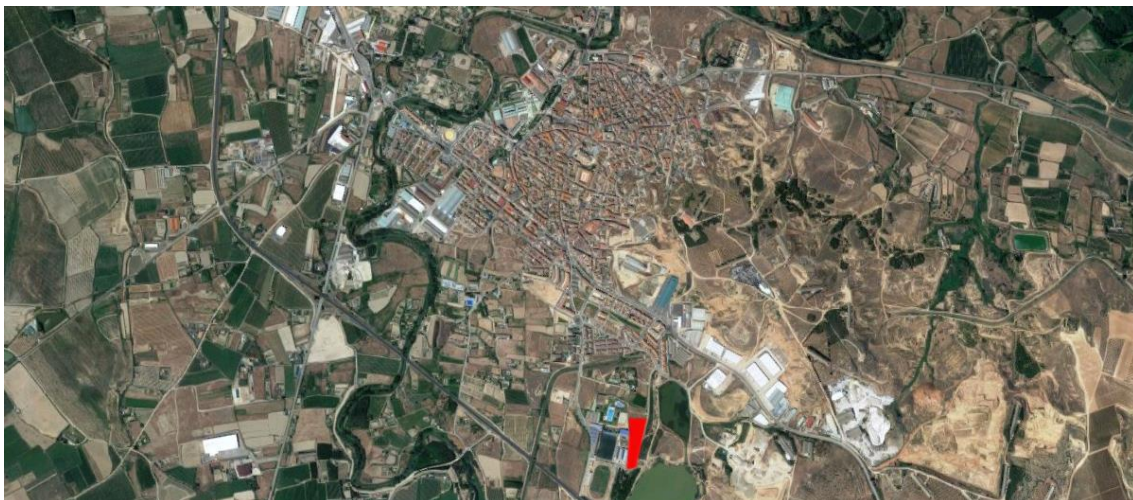
Fig.5.61. Plano de situación de la parcela donde se ubicará la pista de pump track.

Para este proyecto se ha seleccionado por parte de los responsables políticos una parcela de propiedad municipal que reúne muy buenas condiciones de localización, espacio, geometría, así como el consenso general de todos los agentes implicados. La parcela tiene acceso desde el Camino de la Dehesilla y pertenece al complejo del Polideportivo Municipal de La Molineta.